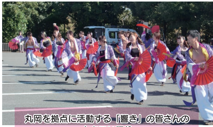
丸岡を拠点に活動する「響き」の皆さんの よさこい踊り