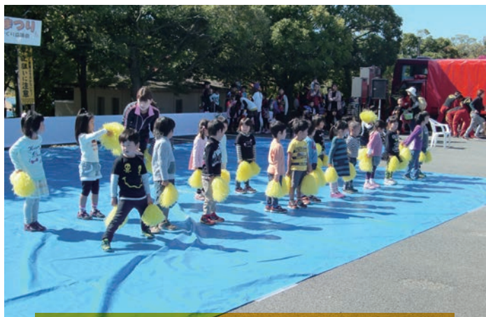
三国松涛保育園のかわいい園児の踊りです。