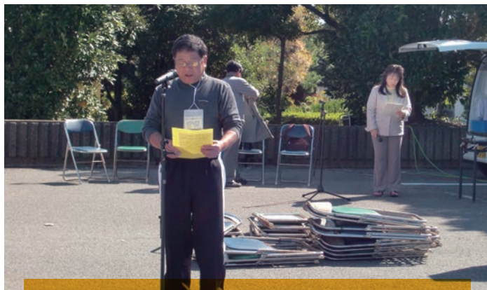
目頃のお礼と、今後とも当協議会へのご理解と御協力をお願いする、北畑会長からのご挨拶。