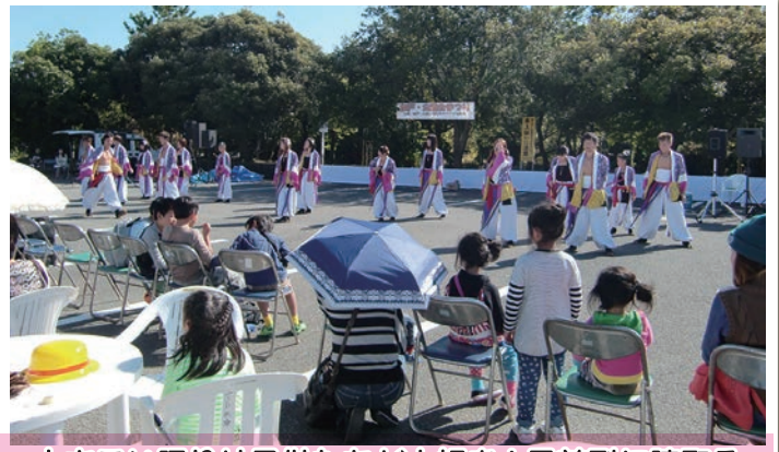
よさこい踊りは子供たちが大好き！最前列に陣取る