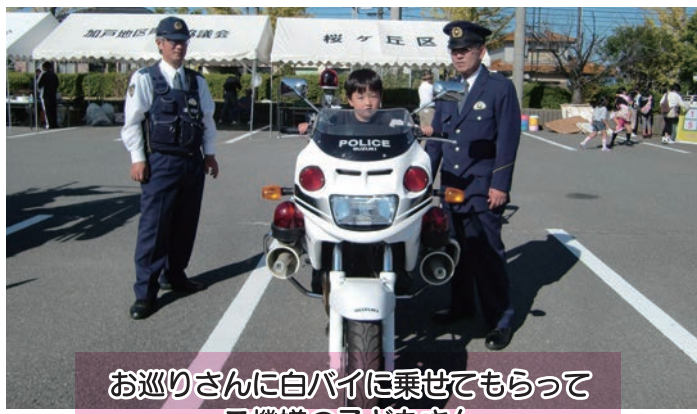
お巡りさんに白バイに乗せてもらって ご機嫌の子どもさん