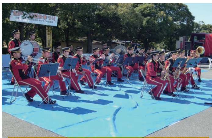
嶺北消防音楽隊の皆さんの壮大な管楽器の演奏