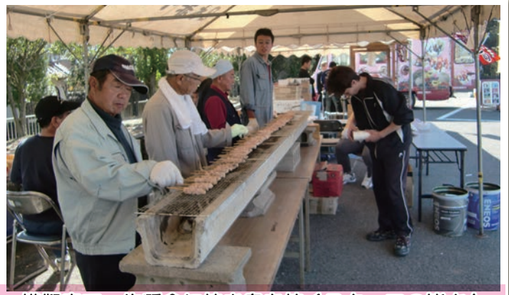
模擬店で一生懸命に焼き鳥を焼くスタッフの皆さん

子供縁日には、ヨーヨー・輪投げ・くじ引き、展示コーナーでは白バイ・消防車に子供たちも見入り、ブル ジル焼き・軽トラ市・ハスの実の家のパンなどの催しがあり、当地区内区民の親睦が図れた一日となりました。