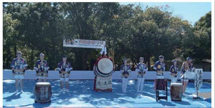
今から400年余り前、三国を襲った大嵐を沈める為 打ち鳴らしたとされる、火の太鼓の皆さん