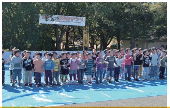
4歳児と5歳児全員で「シンデレラのスープ」を熱唱