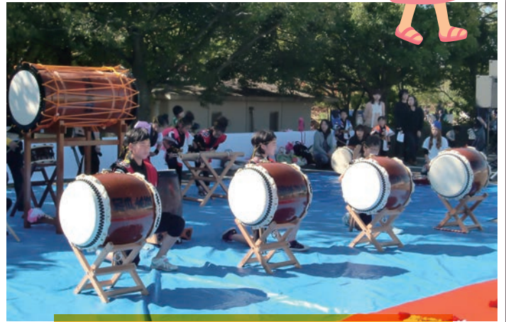
力強い勇壮な「加戸子供太鼓」の皆さん