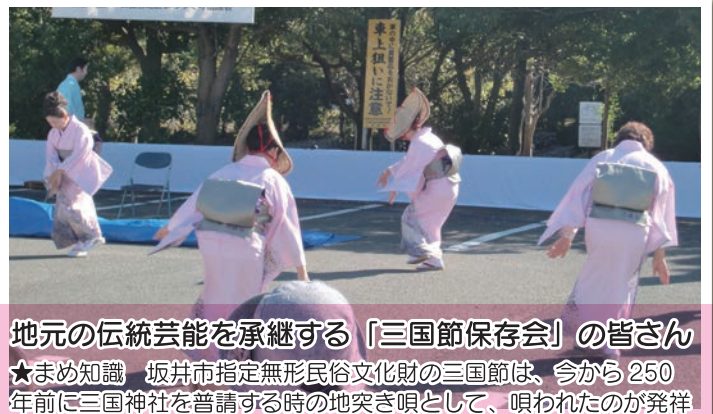
地元の伝統芸能を承継する「三国節保存会」の皆さん ★まめ知識 坂井市指定無形民俗文化財の三国節は、今から250 年前に三国神社を普請する時の地突き唄として、唄われたのが祥祥 と云われています。