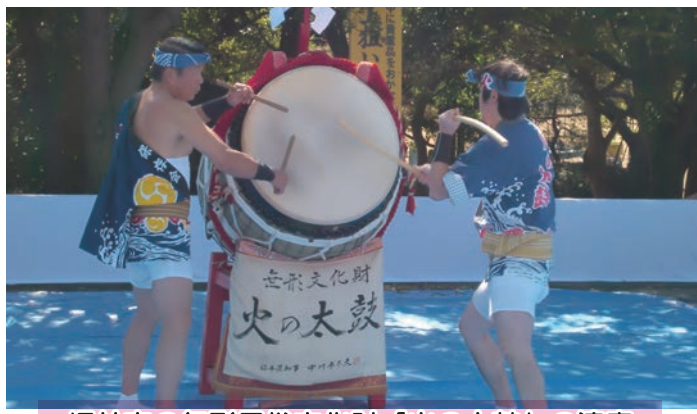
坂井市の無形民俗文化財「火の太鼓」の演奏