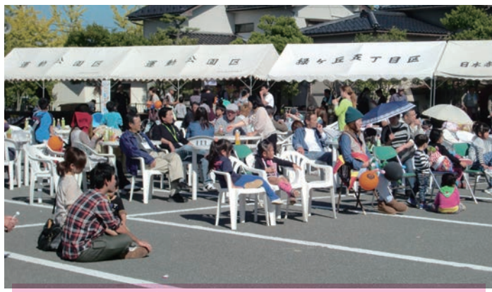
上の写真の“よさこい”に来場者の目は釘づけ？